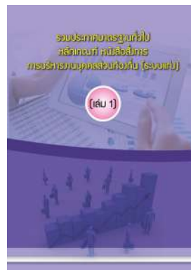
หนังสือ รวมประกาศมาตรฐานทั่วไป หลักเกณฑ์ หนังสือสั่งการ การบริหารงานบุคคลส่วนท้องถิ่น