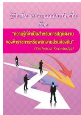
หนังสือ ความรู้ที่จำเป็นสำหรับการปฏิบัติงาน ของข้าราชการหรือพนักงานส่วนท้องถิ่น (Technical Knowledge)